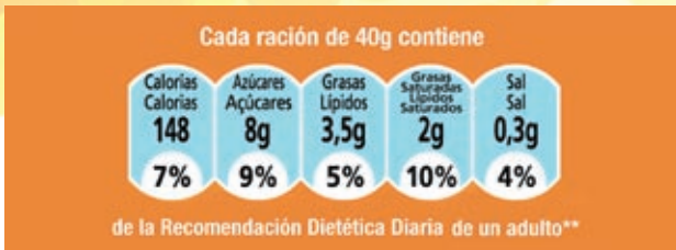
FIGURA 1. Ejemplo de etiquetado en base a las CDOs.